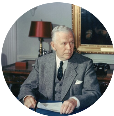
GEORGE C. MARSHALL

Por este motivo recibió el Premio Nobel de la Paz en 1953. Su figura, admirada por su moderación, rigor y altura de miras, ha sido aclamada tanto por historiadores como por líderes de generaciones posteriores.